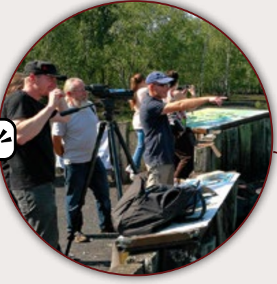
MARE À GORIAUX RAISMES