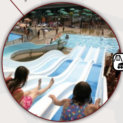
PARC D'ATTRACTIONS LE FLEURY WAVRECHAIN-SOUS-FAULX