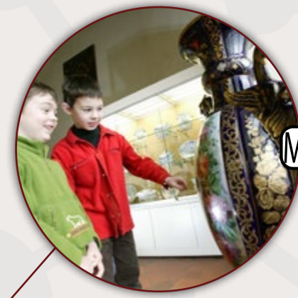
MUSÉE DE LA TOUR ABBATIALE SAINT-AMAND-LES-EAUX