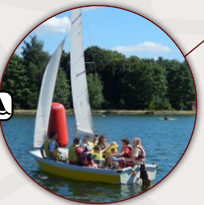
BASSIN ROND BOUCHAIN