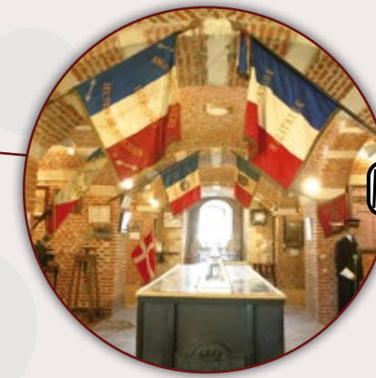
MUSÉE DE LA TOUR D'OSTREVENT BOUCHAIN