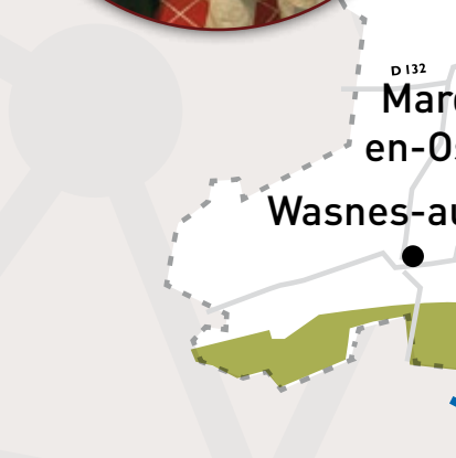
MUSÉE DES ARTS ET TRADITIONS POPULAIRES ESCAUDAIN