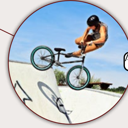
PARC LOISIRS ET NATURE DE LA PORTE DU HAINAUT RAISMES