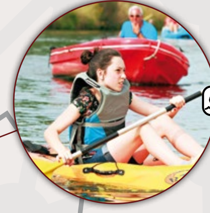
PORT FLUVIAL DE LA PORTE DU HAINAUT SAINT-AMAND-LES-EAUX