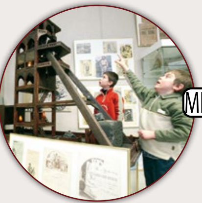
MUSÉE D'ARCHÉOLOGIE ET D'HISTOIRE LOCALE DENAIN