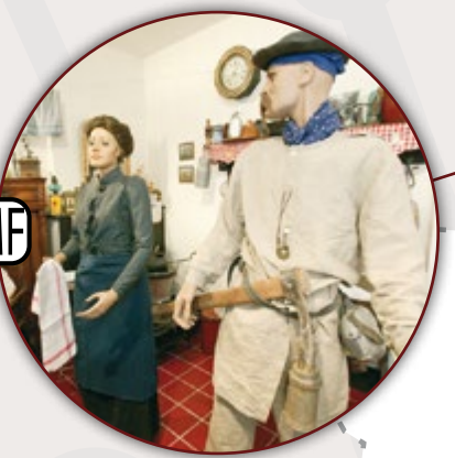
MUSÉE DES ARTS ET TRADITIONS POPULAIRES ESCAUDAIN