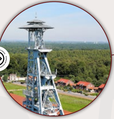
SITE MINIER WALLERS-ARENBERG