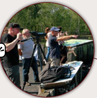
MARE À GORIAUX RAISMES