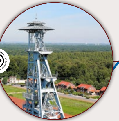
ARENBERG CREATIVE MINE SITE MINIER WALLERS-ARENBERG