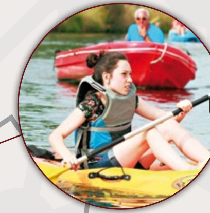
PORT FLUVIAL DE LA PORTE DU HAINAUT SAINT-AMAND-LES-EAUX