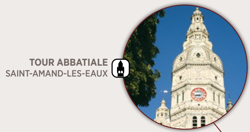
TOUR ABBATIALE SAINT-AMAND-LES-EAUX