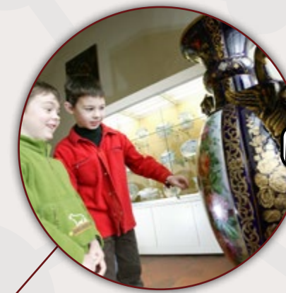
MUSÉE DE LA TOUR ABBATIALE SAINT-AMAND-LES-EAUX