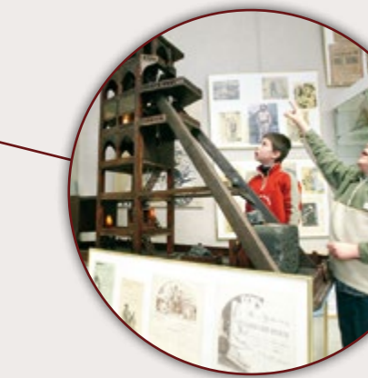
CRP/CENTRE RÉGIONAL DE LA PHOTOGRAPHIE HAUTS-DE-FRANCE DOUCHY-LES-MINES