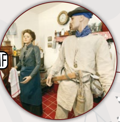
MUSÉE DES ARTS ET TRADITIONS POPULAIRES ESCAUDAIN