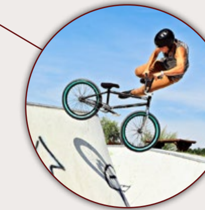
PARC LOISIRS ET NATURE DE LA PORTE DU HAINAUT RAISMES