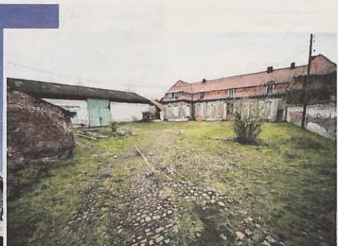
Le Château des Douaniers, rue Gambetta, à Fresnes-sur-Escaut, dans un piteux état, pourrait bénéficier d'une souscription lancée par la Mission Bassin minier.

50 000 euros pour chacune des deux agglomérations de l'arrondissement. Comme cette action par exemple des jeunes du centre social Dutemple à Valenciennes qui ont sillonné les quartiers à la rencontre des habitants pendant trois jours pour les interroger sur le classement du bassin minier. Le classement, Thierry Devimeux y voit un « facteur d'attractivité du territoire. On a la chance d'avoir une superbe histoire à raconter. » Encore faut-il qu'elle soit entendue... ■