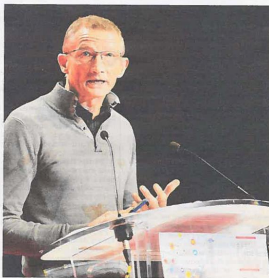
Le maire de Loos-en-Gohelle a tracé de nouvelles perspectives.