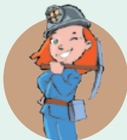
LE PATRIMOINE MINIER